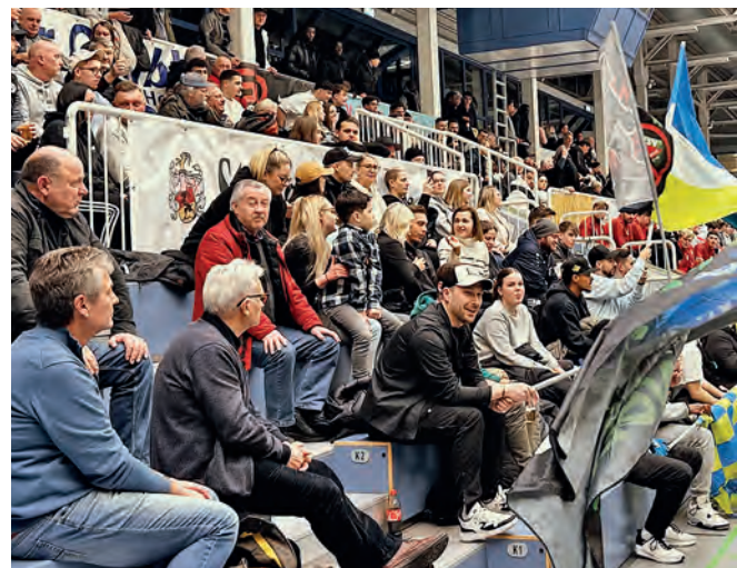
Enttäuschte Gesichter auf Katernberger Seite nach der Finalniederlage gegen den A-Kreisligisten Al-Arz.