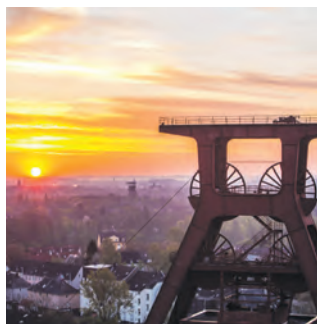
Blick über den Stadtbezirk VI – Zollverein.

Wie geht es weiter mit Zollverein und Umgebung? Die Stadt Essen und die Stiftung Zollverein laden alle Anwohnerinnen und Anwohner aus den Stadtteilen Katernberg, Schonnebeck und Stoppenberg sowie weitere Interessierte zu einer Informationsveranstaltung ein. Am Montag, 9. Februar 2026, zwischen 17 und 19 Uhr, stellen sie den Anwesenden die geplanten Maßnahmen und Ideen aus dem neuen Integrierten Entwicklungskonzept (IEK) vor. Im Anschluss können die Teilnehmerinnen und Teilnehmer in einer Diskussion ihre Fragen und Anregungen mit der Stadt Essen und der Stiftung Zollverein teilen. Die Veranstaltung findet im Koks-Kohlenbunker auf dem UNESCO-Welterbe Zollverein statt. Weitere Informationen gibt es unter essen.de/iekzollverein