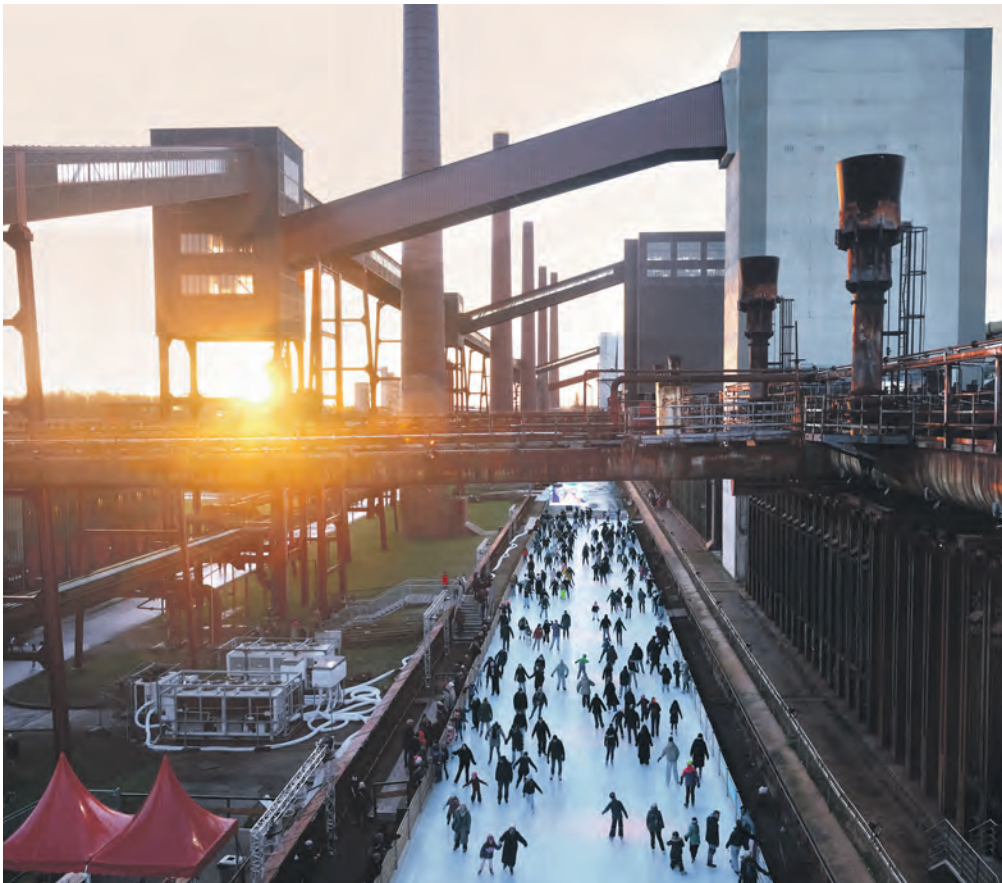
Ein Ort für alle: die Zollverein-Eisbahn.

Über 42.000 Gäste drehten ihre Runden zwischen Koksöfen und Schornsteinen