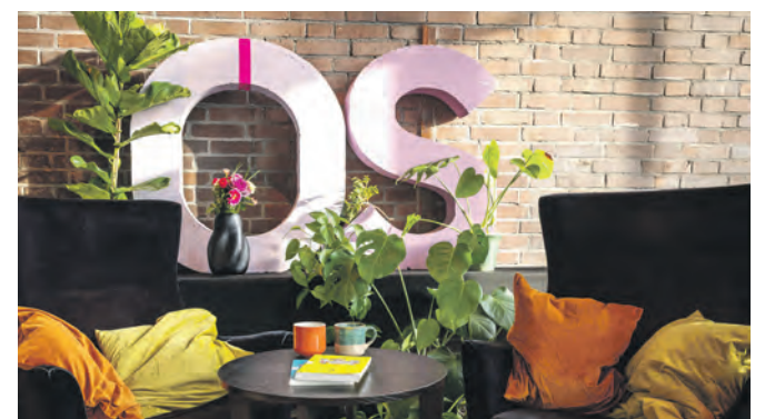
Literatur trifft Industriekultur.

2026, um 19 Uhr, sein leidenschaftliches Werk über Verantwortung, Selbstwirksamkeit und den Mut, sich einzumischen. In dem Buch entfaltet er seine Ideen rund um die Themen Sprache und Literatur, Migration und Integration, Jugend und Herkunft. Tickets gibt es ab 11 Euro. Mehr Informationen unter zollverein.de/offene-seiten