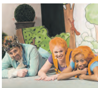
Abenteuer mit Hexe Kleinlaut auf Zollverein.

In der Reihe „Abenteuer Aalto“ der Theater und Philharmonie (TUP) Essen dreht sich am Samstag, 14. Februar 2026, alles um das Märchen von Petrosinella. Hexe Kleinlaut sorgt in der Theateraufführung „Petrosinella, lass dein Haar herunter!“ wieder für Aufregung. Genau wie Rapunzel hat Petrosinella langes Haar, an dem der Traumprinz den Turm hinaufklettern kann. Eigentlich wollte Hexe Kleinlaut nur die Petersilie in Omas Küche schneller wachsen lassen, doch dann steht Petrosinella ohne Haare auf dem Kopf da. Wie der Prinz und Hexe Kleinlaut das Problem lösen, können sich Gäste ab 3 Jahren in Halle 12 ansehen. Tickets sind ab 7,50 Euro erhältlich.