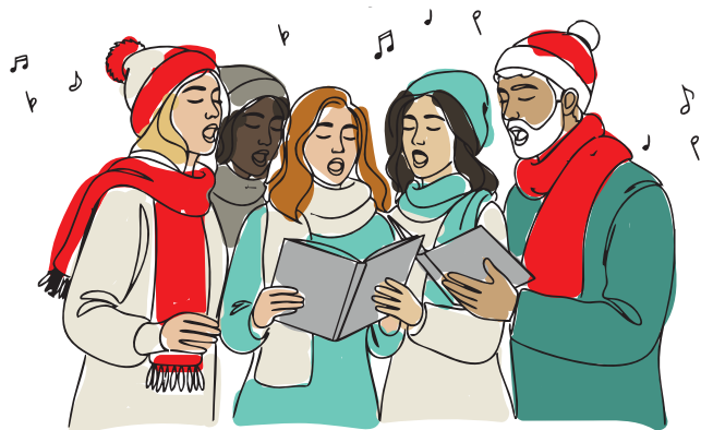
Einstimmen auf die Vorweihnachtszeit beim gemeinsamen Singen.

Übrigens: Es gibt einen bestimmten Grund, wieso die Stiftung Zollverein für das gemeinsame Singen den 4. Dezember ausgewählt hat. Traditionell gedenken Bergleute an diesem Tag ihrer Schutzpatronin, der Heiligen Barbara. Genauso wie der starke Zusammenhalt der Bergmänner steht das Weihnachtsliederauffrischungsseminar für ein offenes Miteinander. Es ist Brauch der Bergleute, am Tag der Heiligen Barbara frische Kirschenzweige aufzustellen. Blühen diese an Weihnachten, wird es ein glückliches Jahr.