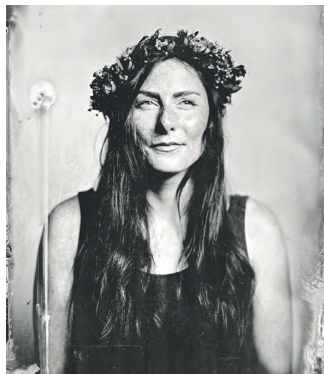
Paul Walther beschreibt sich in erster Linie als Menschenfotograf, begeistert sich aber auch für industrielle Motive.

Ich bin circa 200 Meter von der Kokerei entfernt aufgewachsen, habe erlebt, wie sie hier noch in Betrieb war. Mit 13 Jahren habe ich angefangen, zu fotografieren und bin mit meiner Kamera nachts über die Gleise eingebrochen. Damals hat mich der Sicherheitsdienst dann über die Gleise wieder rausbegleitet. Als die Kokerei geschlossen wurde, war für mich klar, irgendwann willst du hier mal dein Atelier haben.