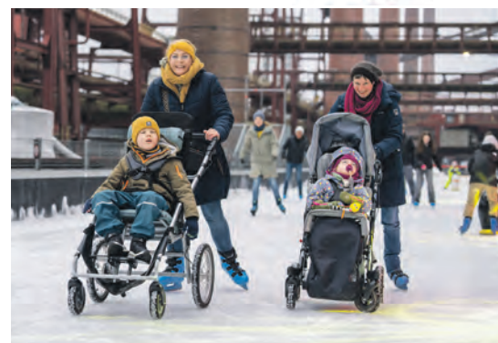
Über eine Rampe kommen Menschen im Reha-Buggy, Rollstuhl oder mit Gleithilfe aufs Eis.