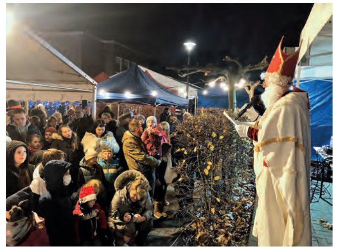
Ab 17.30 Uhr schaut auch der Nikolaus vorbei.

Der Katernberger Werbering richtet den Nikolausmarkt erneut aus und bietet ein umfangreiches Angebot an Verkaufs- und Informationsständen. Die Veranstaltung wird unterstützt von der Bezirksvertretung VI-Zollverein, der Sparkasse Essen, der Evangelischen Kirchengemeinde Katernberg, dem Bürgerzentrum Kon-Takt sowie der DJK-Sportfreunde Katernberg 13/19.