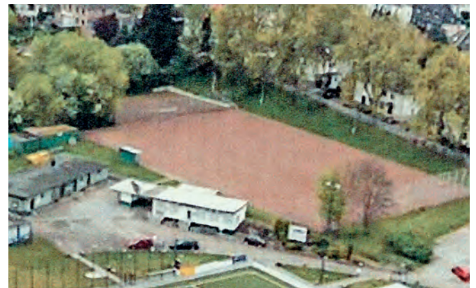
Hier eine Luftbildaufnahme des alten Aschenplatzes von 2014.

und RW Erfurt wechselten, hatte die Mannschaft im Sommer einen deutlichen Umbruch zu bewältigen. Die neu zusammengestellte Truppe hat sich jedoch schnell gefunden und präsentiert sich aktuell als stabiler und konkurrenzfähiger Oberligist. In der vergangenen Saison gewann jede Mannschaft eines der Meisterschafts-Derbys.