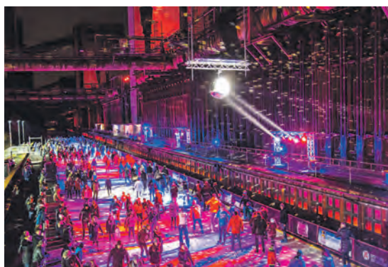
An den Eisdisco-Abenden glitzern die Discokugeln mit dem Eis um die Wette.