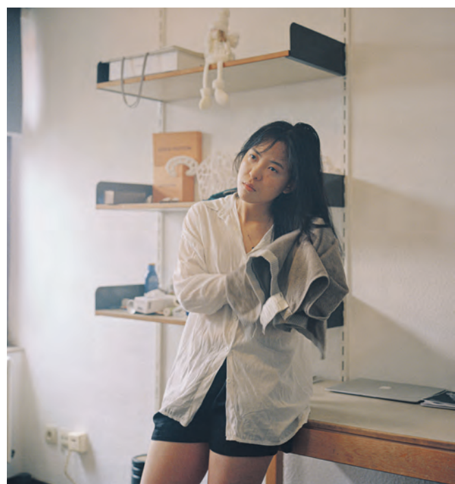
Es scheint, als seien die jungen Frau auf dem Sprung – doch auf dem Sprung wohin?

Einsamkeit und neue Kraft Insgesamt hat sie über 60 Frauen porträtiert; die Ausstellung im Rundeindicker umfasst 23 Bilder. Die Bilder vermitteln das Gefühl