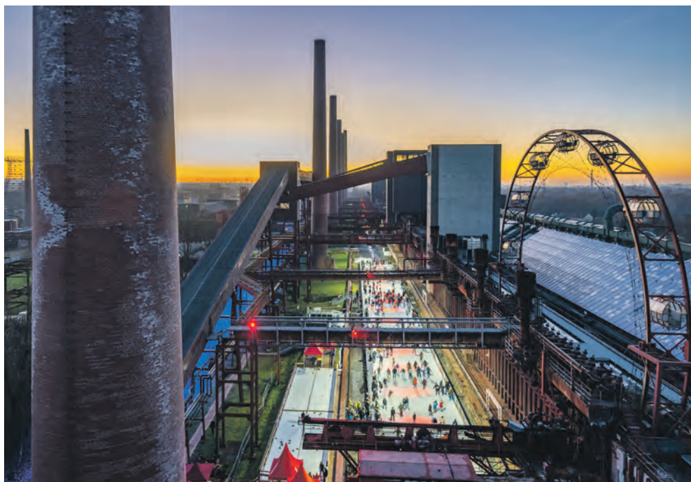
Die Zollverein-Eisbahn sorgt für ein einzigartiges Wintervergnügen zwischen den Schornsteinen und der Koksofenbatterie auf der Kokerei Zollverein.

Einzigartige Eisbahn in beeindruckender Industriearchitektur