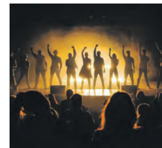
DAS RUHRICAL bietet eine starke Show.

DAS RUHRICAL verbindet Pop und Rock, Musical und Schlager. Dabei erzählt es Geschichten aus der Region – ehrlich, leidenschaftlich und mit einem unverwechselbaren Humor. An insgesamt fünf Terminen von Mittwoch, 3., bis Sonntag, 7. Dezember 2025, begeistert das Ensemble sein Publikum auf dem UNESCO-Welterbe Zollverein. Bei der Premiere im März reisten die Zuschauerinnen und Zuschauer aus ganz Deutschland und der Schweiz an. Die Darstellerinnen und Darsteller sind hingegen allesamt