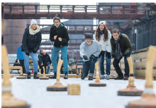
Welches Team bringt seinen Eisstock am nächsten ans Ziel und holt damit den Sieg?