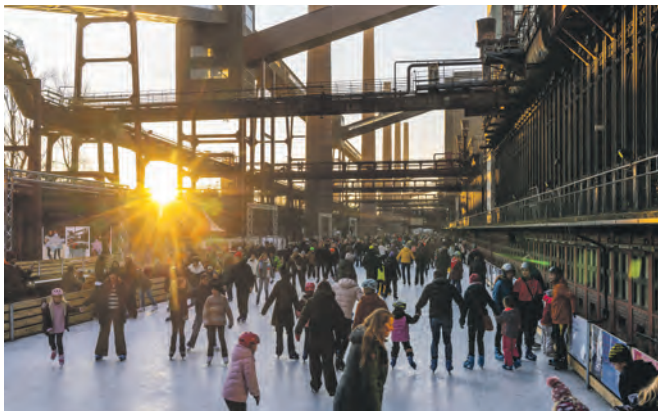
Sonnenstrahlen hüllten die umliegende Industriearchitektur in stimmungsvolles Licht.

Auch wenn Eisbahn, Schlittschuhbude, Winterdorf sowie die Anlage zum Eisstockschießen nun abgebaut werden und die Hilfspinguine ihren wohlverdienten Urlaub antreten: Nach der Eisbahn ist vor der Eisbahn, denn im Dezember 2025 kehrt das Winterparadies für die nächste Saison auf die Kokerei zurück. Wer sich die Wartezeit verkürzen will, tauscht das Eis gegen Estrich und die Schlittschuhe gegen Rollschuhe: In den NRW-Osterferien – von Samstag, 12., bis Sonntag, 27. April 2025 – können Klein und Groß nach Herzenslust auf 600 Quadratmetern skaten. Dann wird Halle 5, die ehemalige Zentralwerkstatt der Zeche Zollverein, zur Rollschuhbahn. Zusätzlich zu den täglichen Laufzeiten gibt es an einigen Abenden besondere Angebote wie Workshops und Rollerdiscos.