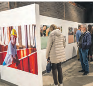
Industriegeschichten werden lebendig.