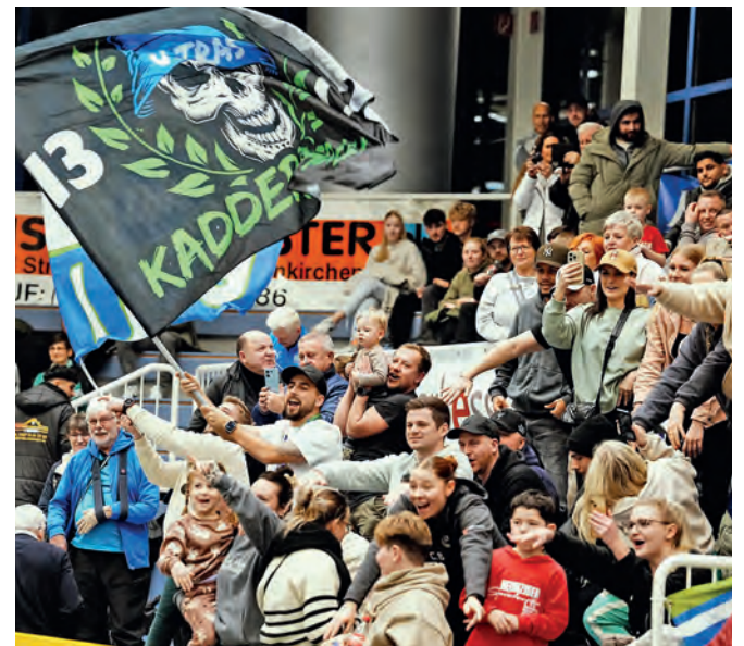
Der Katernberger Anhang war nach dem Sieg nicht mehr zu halten.

nutzt werden soll. Fischer: „Die positive Stimmung wollen wir in die Rückrunde mitnehmen.“ Und wenn dann auch die Grippewelle endlich abgeflacht sein sollte, kann es für den Trainer nur ein Motto geben: „Wir wollen vorneweg marschieren!“