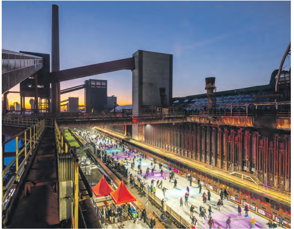
Abendstimmung auf der Zollverein-Eisbahn.