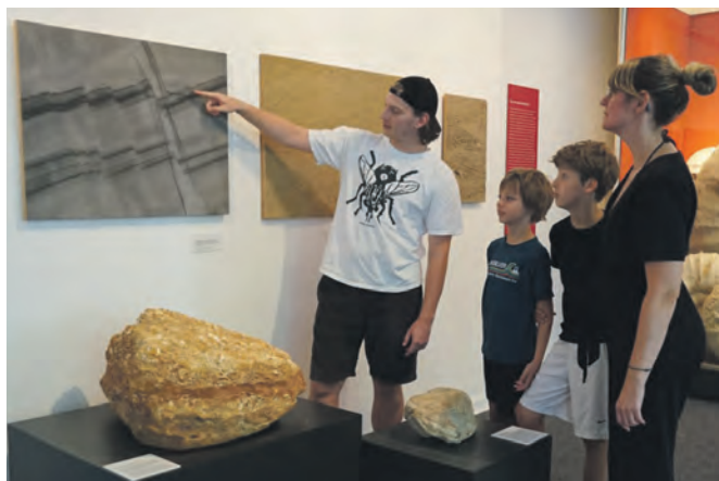
Das Mineralien-Museum bietet vor allem für Familien regelmäßig Führungen und Workshops an.

Wie klingen Steine? Und welche Kostbarkeiten verstecken sich in der Kristallkammer?