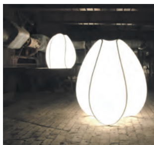
Trends im Produktdesign zeigt die Ausstellung „Design on Stage“.

Auf fünf Etagen erhalten Besucherinnen und Besucher in der Sonderausstellung „Design on Stage“ einen umfassenden Einblick in den aktuellen Stand der Designkunst. Um die Produkte während des Rundgangs selber besser beurteilen zu können, haben Gäste zu Beginn die Möglichkeit, mithilfe kurzer Einführungstexte und beispielhafter Objekte das eigene Auge zu schulen.