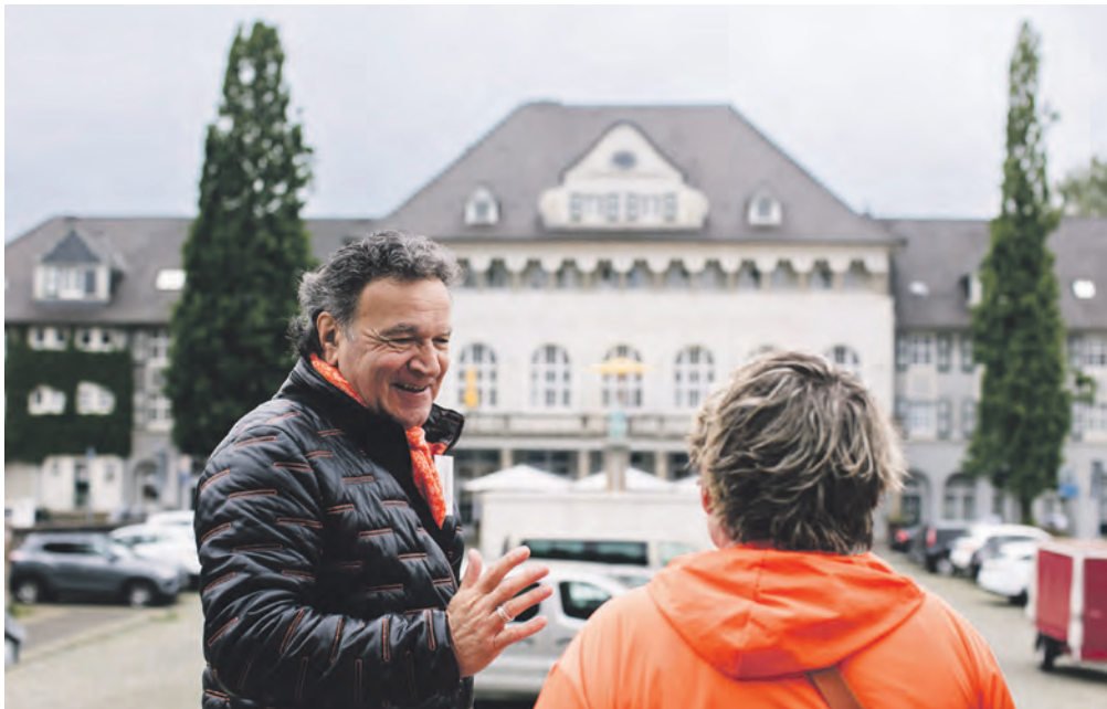
Bei einem Rundgang durch die Margarethenhöhe erfahren Interessierte mehr über die Entstehungsgeschichte und Hintergründe der grünen Gartenstadt.

Die Gartenstadtsiedlung wurde als Gesamtkunstwerk angelegt. Die Gebäude, Grünbereiche, Straßen und Plätze sind harmonisch aufeinander abgestimmt und sollten so zur Lebensqualität der Bewohnerinnen und Bewohner beitragen. Angestellten- und Arbeitersiedlungen wie die Margarethenhöhe bildeten einen Gegenpol zum Wildwuchs im Städtebau im Zuge der Industrialisierung. Die Gartenstadtsiedlung wurde durch Margarethe Krupp gestiftet und durch den Architekten Georg Metzendorf ab 1909 umgesetzt. Insgesamt dauerte der Bau bis ins Jahr 1938; in der Siedlung wohnten Kruppsche Werksangehörige sowie Angestellte der Stadt Essen.