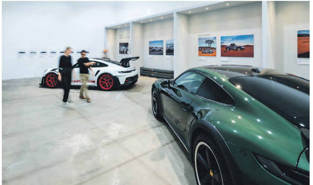
Der eine ist auf Schnelligkeit ausgelegt – der andere auf Robustheit: Welche Gemeinsamkeiten und Unterschiede weisen die Porsche-Modelle 911 GT3 RS und 911 Dakar auf?

Aus technischer Sicht könnten sie kaum unterschiedlicher sein – ihre Gestaltung geht aber auf ein Urmodell zurück. Gemeint sind die beiden Porsche-Modelle 911 GT3 RS und 911 Dakar. Seit den 1960er-Jahren verschmelzen beim Porsche 911 nicht nur Technologie und Design miteinander, sondern auch Tradition und