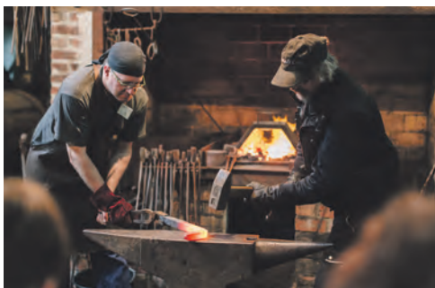
Welche Schätze hütet das Ruhrgebiet? Einen Einblick gewähren die Außenstellen des Ruhr Museums. Hier: der Halbachhammer und die Kulturlandschaft Deilbachtal.

Knapp einen Kilometer von der Margarethenhöhe entfernt erhalten Besucherinnen und Besucher im Halbachhammer einen Eindruck vom Hütten- und Schmiedeprozess, bei dem aus Roheisen Stahl erzeugt wurde. Ursprünglich war das Denkmal in Weidenau an der Sieg beheimatet und wurde bereits im Jahr 1417 urkundlich erwähnt. Gustav Krupp von Bohlen und Halbach ist es zu verdanken, dass die „Hammerhütte“ nach ihrer Stilllegung nach Essen umgesiedelt wurde.