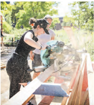
Kapp- und Gehrungssäge bedienen statt Büroalltag bewältigen.

Für gut eine Woche tauschten 63 Auszubildende der Sparkasse Essen ihr Business-Outfit gegen Handwerkskleidung. Die Sparkasse Essen feiert in diesem Jahr das 20-jährige Jubiläum ihres Azubi-Spielplatzprojekts – dabei herausgekommen ist ein neuer Spielplatz im Zollverein Park. Es ist das Ergebnis einer langjährigen Kooperation mit der Stiftung Zollverein. Gemeinsam mit den Landschaftsarchitekt:innen von „Die Planergruppe“ wurde ein Konzept entwickelt, welches sich auf den Ausbau von Spielmöglichkeiten auf dem Welterbe fokussiert. Rund um den Färbergarten im Zollverein Park entstanden ein Kletterturm mit Tunnelrutsche, ein Balancier-Parcours und Verweilmöglichkeiten. Die Spieltauglichkeit überprüften Kinder aus den Zollverein-Kindergärten „Blauer