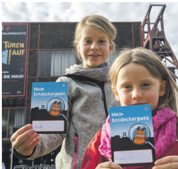
Jede Menge los: Junge Entdeckerinnen und Entdecker erkunden am Maustag, 3. Oktober 2024, das Welterbe.

Zum Maustag lädt das Ruhr Museum Familien ein, einen Blick in die Dauer- und Sonderausstellungen zu werfen und so die faszinierende Natur- und Kulturgeschichte des Ruhrgebiets zu erkunden. An zehn Mitmach-Stationen steht das „Tier im Revier“ im Mittelpunkt: Kinder, Jugendliche und ihre Eltern finden beim Memory zusammengehö-