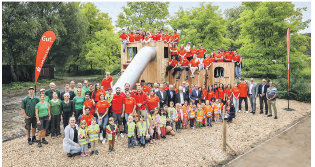
In gut einer Woche haben die Auszubildenden der Sparkasse Essen rund um den Färbergarten im Zollverein Park neue Spielanlagen für Kinder geschaffen.

Das Bauen von Spielplätzen gehört zum festen Bestandteil der Ausbildung bei der Sparkasse Essen und trainiert die Sozialkompetenz der angehenden Kaufleute. Ausbildungsleiter Christoph Höing erklärt: „Unsere Auszubildenden üben sich vor allem darin, als Team gut zusammenzuarbeiten und gemeinsam bestmögliche Lösungen für komplexe Herausforderungen zu finden.“