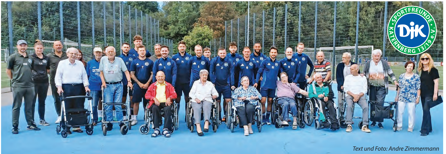
Text und Foto: Andre Zimmermann