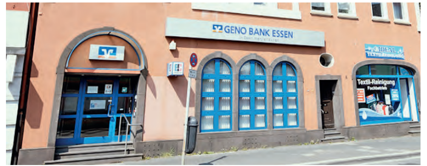
Hier gibt es auch bald wieder Geld am Automaten.

bei anderen Banken in den letzten Jahren wurde die Überprüfung auch daraufhin erweitert. Dabei wurde festgestellt, dass sich über den Automaten eine Holzdecke befindet. Bei einer Automaten Sprengung würde sicherlich ein erheblicher Schaden am Gebäude entstehen und es hätte unter Umständen entsprechende Auswirkungen auf die Bewohner. Daher haben wir vor einigen Wochen den Geldausgabeautomaten im Eingangsbereich unverzüglich außer Betrieb genommen. Obwohl wir auch bisher schon alle heute möglichen Sicherheitseinrichtungen gegen Sprengungen nutzen, haben wir uns auch für die letzte Möglichkeit entschieden. Und das ist eine neue Eingangstür/ Eingangsbereich mit entsprechender Schutzklasse. Die Herstellung der individuellen Tür hat leider deutlich mehr Zeit in Anspruch genommen als erhofft. Ab dem 1. Oktober werden jetzt die noch fehlenden Teile eingebaut und die letzten Arbeiten verrichtet. So-