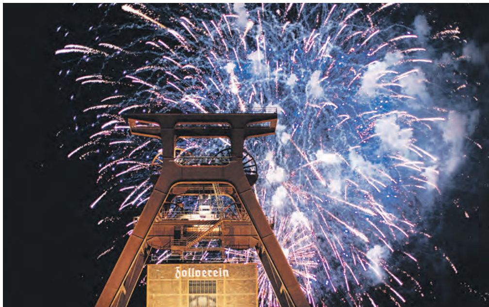
Das große Feuerwerk am Samstag, 28. September 2024 ab 21 Uhr ist ein besonderer Höhepunkt des jährlichen Zecheffests.

Kostenfreie Familienangebote, Steigerlied, Schlagerstars und Feuerwerk