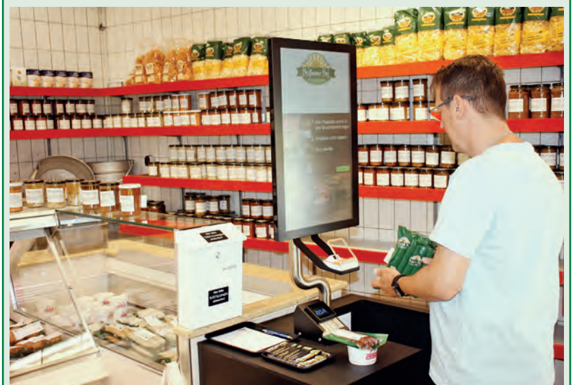
Der Einkauf im SB-Laden ist ganz einfach.