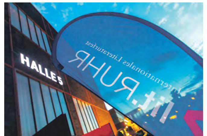
Das gesprochene Wort entführt Menschen in andere Wirklichkeiten – bei der lit.RUHR.

Rufus Beck, der aus „Der kleine Nick“ von René Goscinny liest. Mehr Informationen zum Programm unter zollverein.de/lit-ruhr