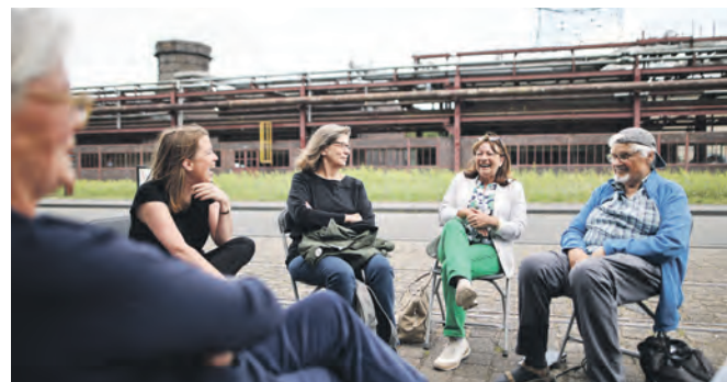
Teilnehmerinnen und Teilnehmer tauschen sich im Workshop über Zukunftsvisionen aus.

Interessierte melden sich bitte bis Freitag, 25.10.2024, per E-Mail an: besucherdienst@zollverein.de .