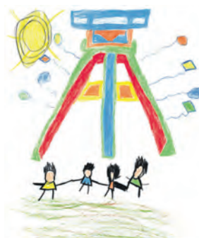
Das Gewinnerbild von Amir.

Bis zum 31. August 2024 konnten Kinder und Jugendliche ihren Motivvorschlag für die beliebten Stofftaschen einreichen, die beim Zecheffest verteilt werden. Amir aus Essen-Katernberg hat den Malwettbewerb gewonnen und sein Kunstwerk wird die rund 1.000 offiziellen Zollverein-Stoffbeutel zieren.